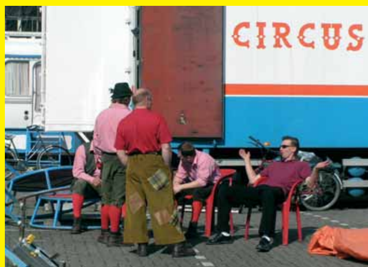
Circusmensen hebben een reizend beroep. Met woonwagens trekken ze met het circus mee. Tegenwoordig zijn deze salonwagens van alle gemakken voorzien.

Circusmensen zijn steeds onderweg. Ze slapen in woonwagens of caravans. Deze zijn tegenwoordig modern uitgerust, zodat de bewoners zich er goed thuis voelen. Ook de kinderen van de circusartiesten reizen mee en krijgen les op een rijdende school.