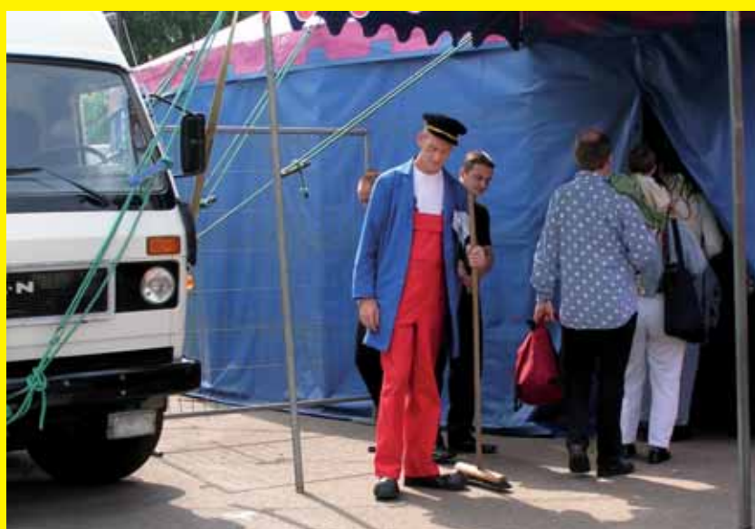
Als er niet opgetreden wordt, maakt een 'clown' zich nuttig door de entree te vegen.