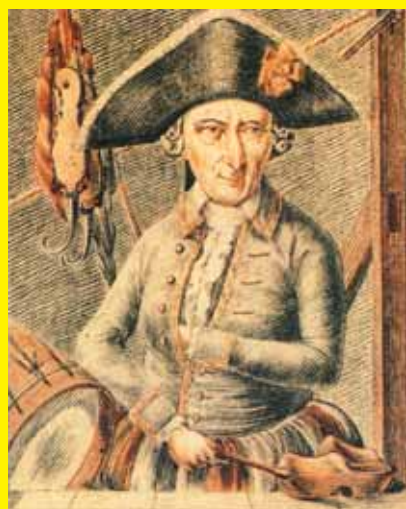
Gravure van Pieter Magito, de koorddanser die in 1796 de eerste circusvoorstelling in Nederland gaf. Hij danste met Friese doorlopers en klompen op het slappe koord.