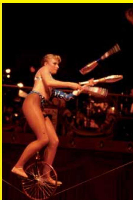
Evenwichtskunstenares jongleert op het slappe koord.