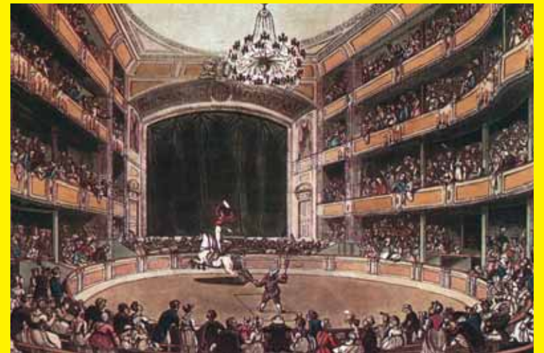
Het circusgebouw van Philip Astley in 1808.