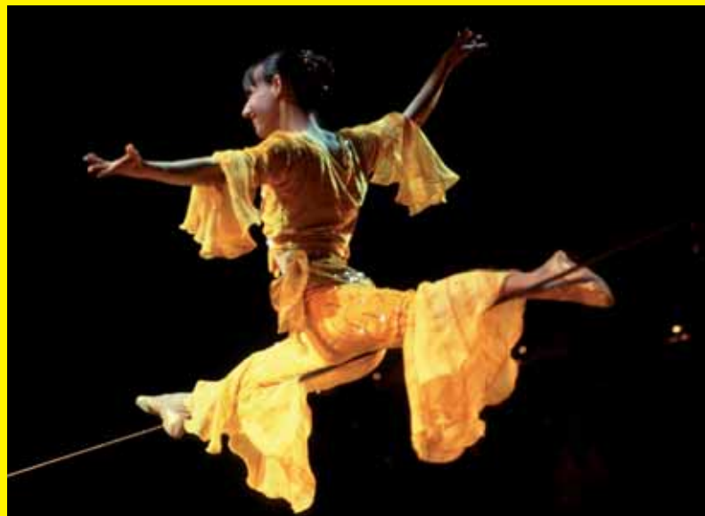
Koorddansen wordt vaak gecombineerd met acrobatiek.