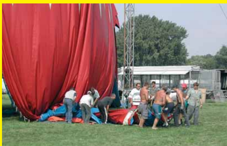
Bij het opbouwen van de tent moet vaak iedereen meehelpen.