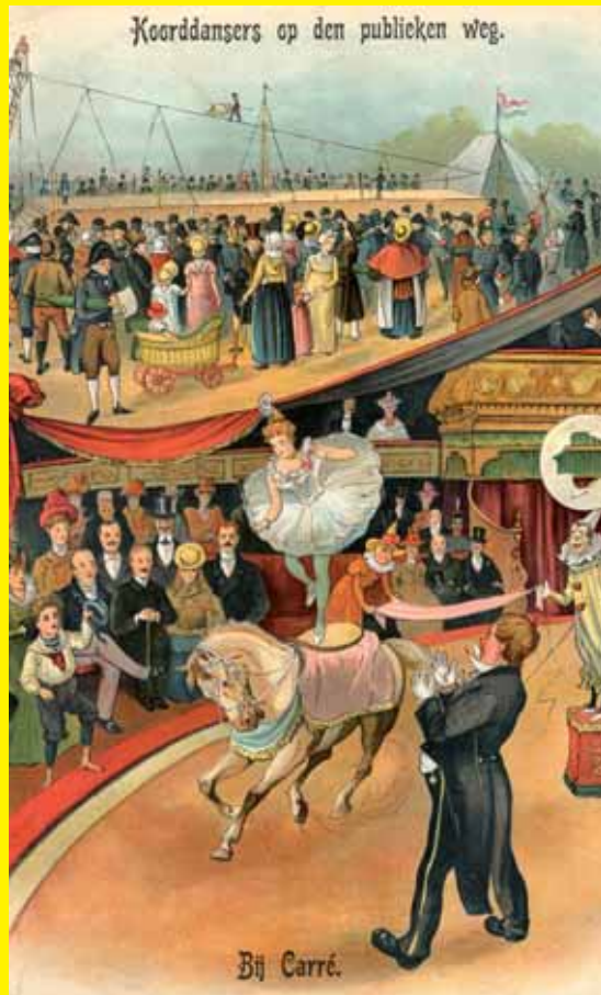
Circus in Nederland is ruim tweehonderd jaar oud.