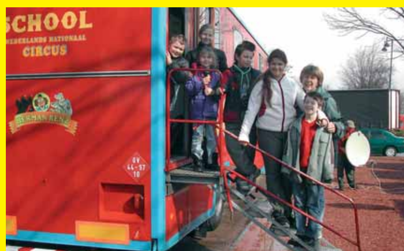
Circuskinderen krijgen les op de rijdende school.

Circusmensen zijn steeds onderweg. Ze slapen in woonwagens of caravans. Deze zijn tegenwoordig modern uitgerust, zodat de bewoners zich er goed thuis voelen. Ook de kinderen van de circusartiesten reizen mee en krijgen les op een rijdende school.