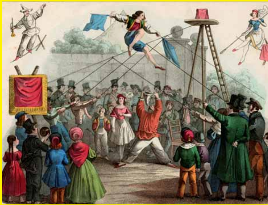
Draadlopen gebeurde vaak buiten. De artiest liep tegen de draad omhoog, terwijl helpers het koord strak trokken.