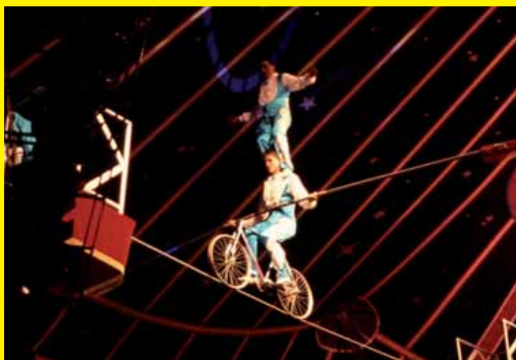
Acrobaten op een fiets balanceren op een strak ijzeren koord.

In de negentiende eeuw werd er voor het eerst ijzerdraad gebruikt voor de koorden. Het was voor de artiest voortaan gemakkelijker om zijn evenwicht te bewaren. De voorstellingen werden vanaf die tijd ingewikkelder. Zo gebruikten koorddansers stoelen, ballen en ringen bij hun optredens.