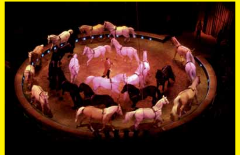
Circus komt van het woord 'cirkel'. De cirkel van de piste waar de circusartiesten optreden.