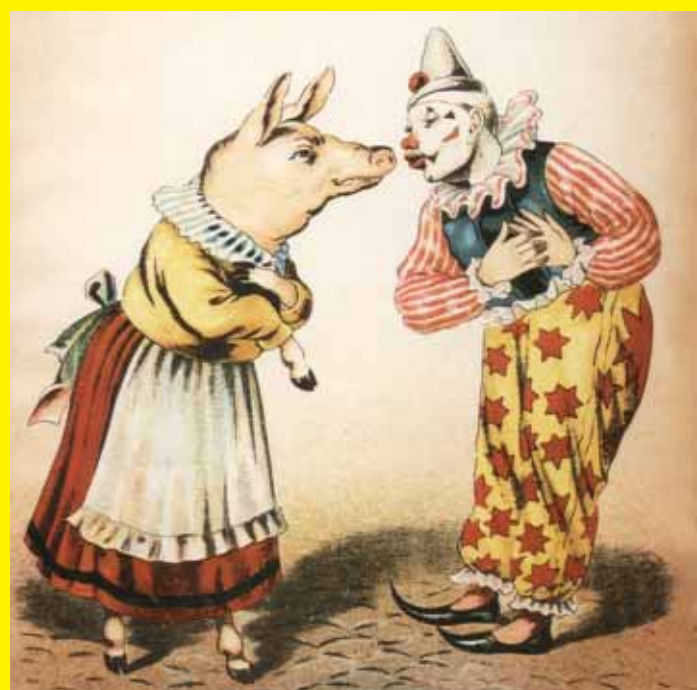
Clowns traden tussen de serieuze circusacts op.