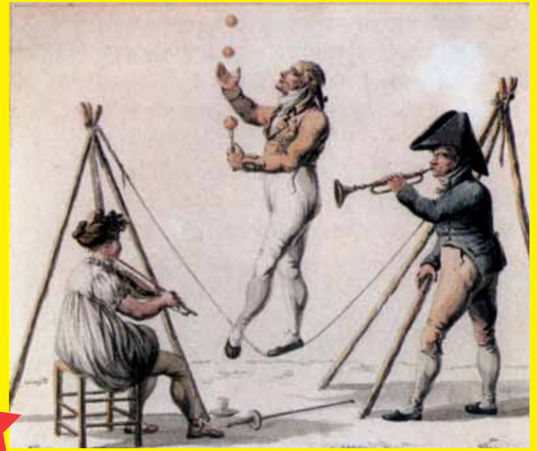
Er zijn twee soorten koorddansen: op het strakke en op het slappe koord. Het slappe koord is een nummer waarbij de artiest jongleert of danst op het koord. Vandaar de naam koorddansen.